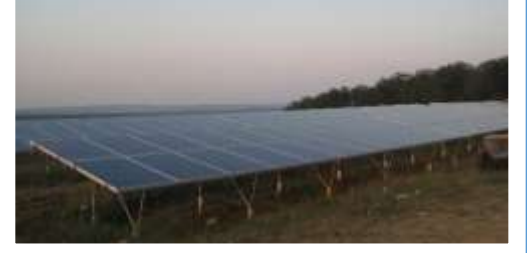
GÜNEŞ ENERJİ SİSTEMLERİ