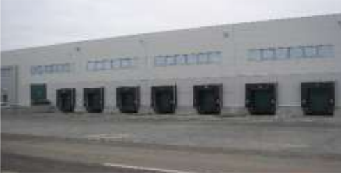
LOJİSTİK DEPOLAR VE HANGARLAR